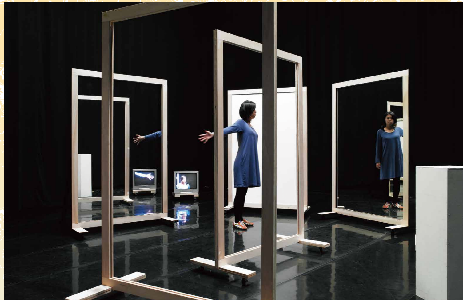
参考写真 | 津田道子「配置の森の住人」王様様 | 2010年 撮影 | 山本朝 提供 | 青森公立大学国際芸術センター青森