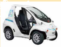
※写真はラッピング前

会場やその周辺に現れる「あいちトリエンナーレ2019」ラッピングの超小型電気自動車を撮影し、写真をInstagramに投稿。抽選であいちトリエンナーレグッズをプレゼントします。 期間 | 1月19日(土)-2月11日(月・祝) [応募条件] ・Instagramのアカウント ・「Recasting Club」をフォロー ・ハッシュタグ「#あいちトリエンナーレ2019ハーマ」を付けて投稿